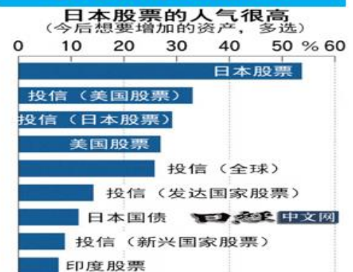
日本民眾投資市場意願調查