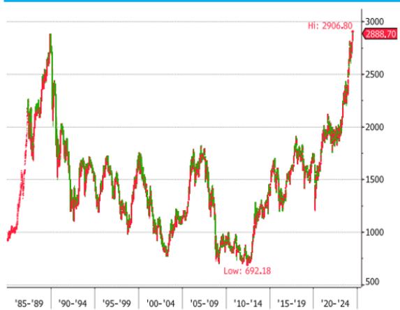
日本TOPIX指數自1985年來走勢