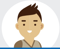
友優沛 (10 歲 男性)