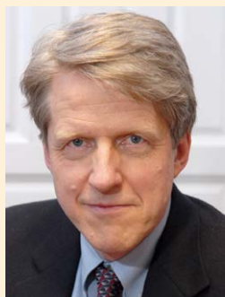
耶魯大學經濟學 羅伯·席勒 教授 Professor Robert J. Shiller